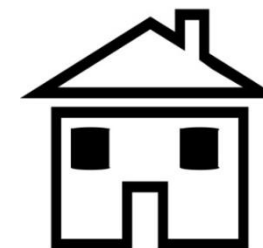
Central Visit Building

Visitas usualmente duran una hora; se te permitirá abrazar y besar a tu ser querido solo al principio y final de la visita. Quizás los separen con un tabique encima de la mesa durante la visita. Niños se pueden sentar con un miembro de su familia que está encarcelado.